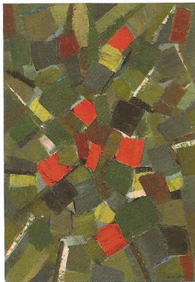
SANS TITRE, 1954. Huile sur toile 81 X 65 cm. Galerie Arnoux, Paris