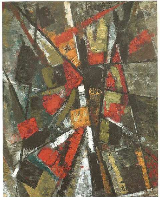
SANS TITRE 1953. Huile sur toile 116 X 89 cm. Collection J.P. Arnoux